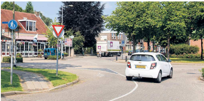
• De bijzondere situatie bij het punt waar de Langenkamp de Gronausestraat kruist zal ook anders zijn na de werkzaamheden.