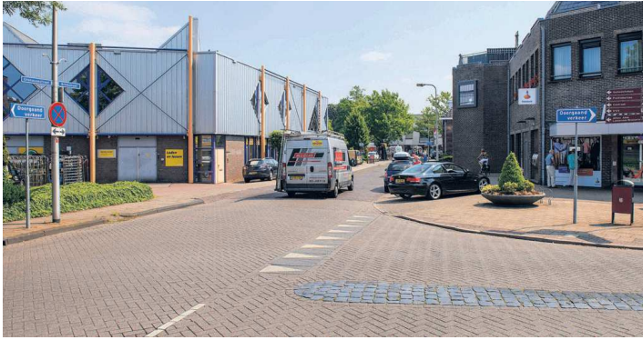
• De kruising van de Gronausestraat met de Brinkstraat zal een metamorfose ondergaan. Hoe is nog niet precies bekend.