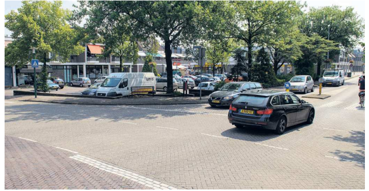
• Ook de kruising van de Gronausestraat met de Raadhuisstraat wordt aangepakt. Afhankelijk van de ontsluiting van de eventuele nieuwe Plus Supermarkt.

▶ Het dorp Losser staat aan de vooravond van een van de ingrijpendste verkeersontwikkelingen van de afgelopen jaren.