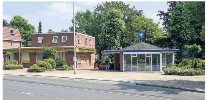
• De Gronausestraat kon er hier wel eens heel anders uit gaan zien als de ontsluiting naar de mogelijke nieuwe Plus Supermarkt hier wordt gesitueerd.